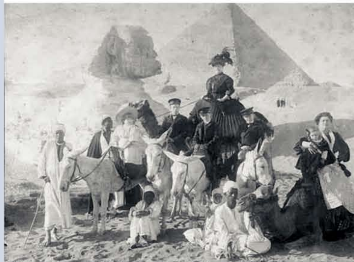
Mit seinen Brüdern (in der Mitte) und der Mutter (im Hintergrund)