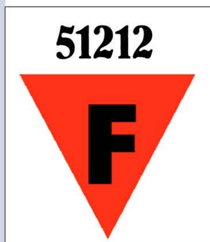
Die Zeichen die Georges Landauer auf der Häftlingskleidung tragen musste